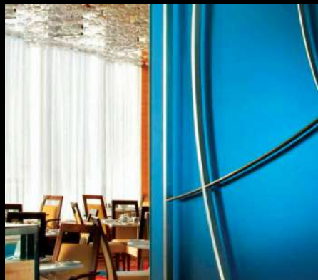
Hotel Marriot Aeropuerto Montreal, Quebec, Canadá Espejo Satinado Starphire ®