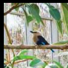
Vidrio Amigable con las Aves