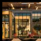
Puertas & Particiones