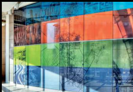
University of Illinois, Nathan Newmark Civil Engineering Building Urbana, Illinois, EE.UU. Mural Impreso Digitalmente directo sobre vidrio Starphire ®