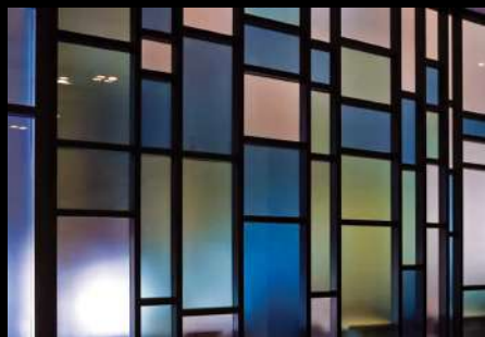
Museo de la Civilización de Quebec Quebec, Quebec, Canadá Espejo Satinado Templado Starphire ®