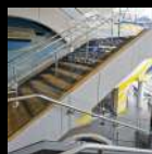
Escaleras & Barandales