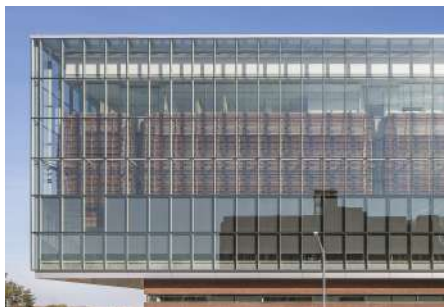
University of Kansas Medical Center Health Education Building Kansas City, Kansas, EE.UU. Fachada con vidrio Starphire ®