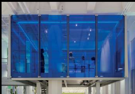
FIDM Los Angeles, California, EE.UU. Vidrio Starphire® Pintado (detrás) en Revestimiento de Muro