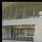
Entradas & Escaparates