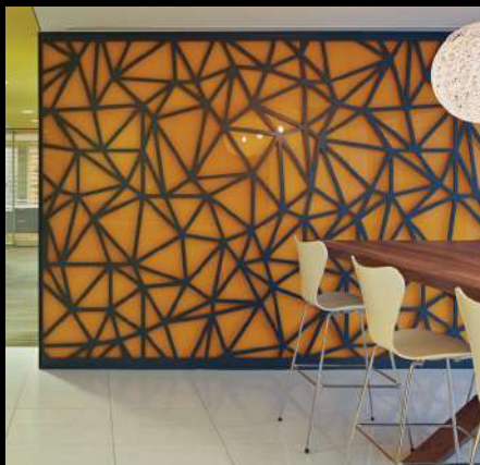
Corporación Apache Calgary, Alberta, Canadá Vidrio Starphire® Pintado (detrás) en Revestimiento de Muro