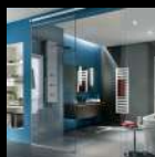
Canceles de Baño