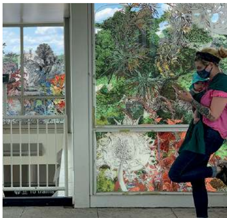
Chicago Transit Authority (CTA) Addison Blue Line Train Station Chicago, Illinois, EE.UU. Cubierta Decorativa con Starphire® con Intercapa Tecnográfica