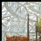
Tragaluces & Domos