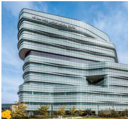
UCSD Jacobs Medical Center California, EE.UU. Fachada de vidrio con Starphire ®