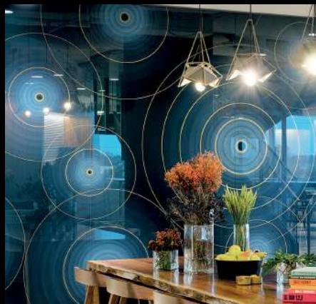
CBRE Oak Brook Oak Brook, Illinois, EE.UU. Mural Impreso Digitalmente directo sobre vidrio Starphire ®