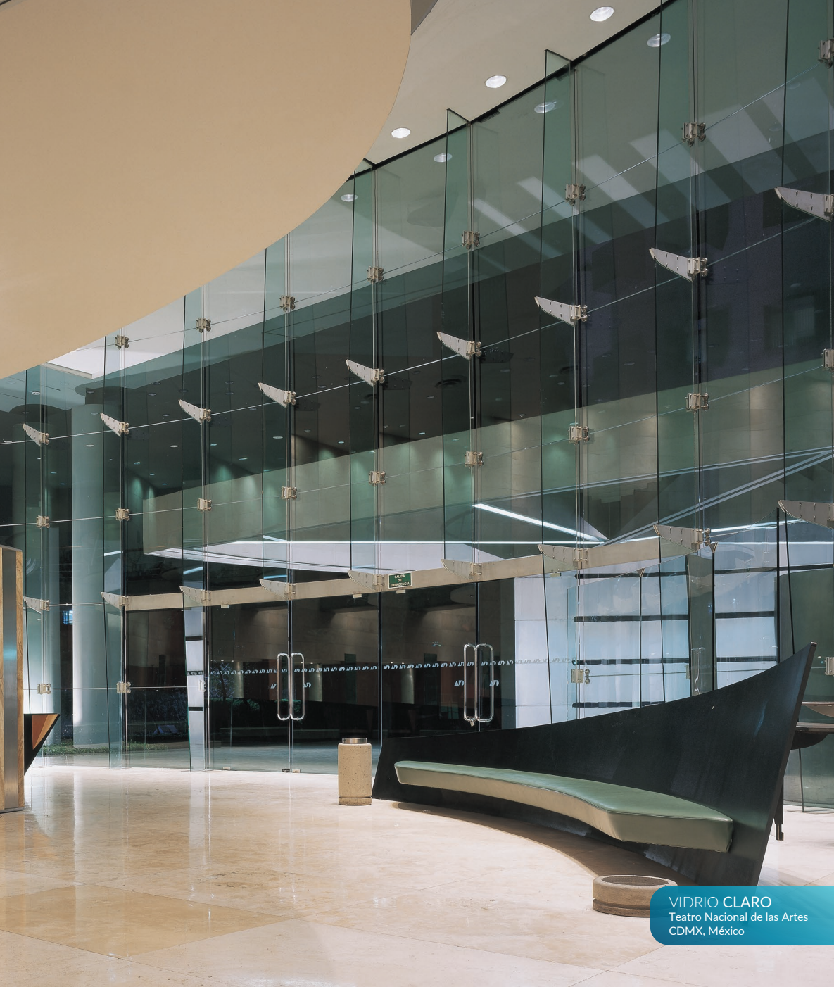
VIDRIO CLARO Teatro Nacional de las Artes CDMX, México